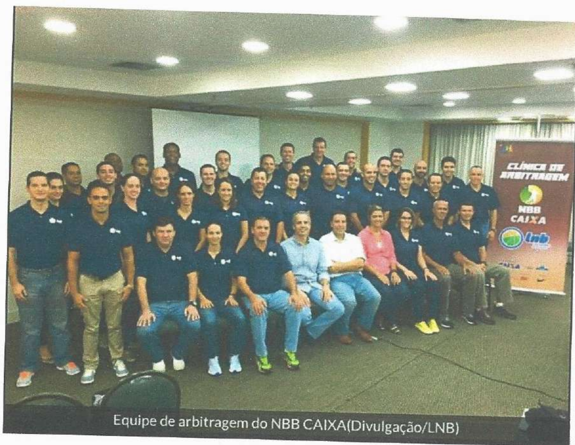
Equipe de arbitragem do NBB CAIXA

PROJETO: Nº SLIE: 1611270-96 TÍTULO: CAPACITAÇÃO EM BASQUETEBOL (LNB) MINISTÉRIO DO ESPORTE LEI 11.438/2008