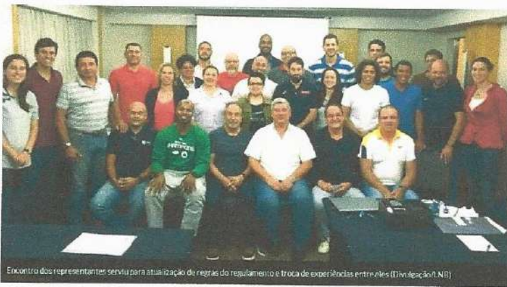
Encontro dos representantes serviu para atualização de regras do regulamento e troca de experiências entre eles

"Tivemos nossas duas metas atingidas: a padronização dos procedimentos relacionados à organização dos jogos, levando-se em conta todas as atualizações inseridas no regulamento, e a multiplicação de experiências com a participação ativa dos representantes expondo problemas e soluções vivenciados na temporada anterior por cada um deles, contribuindo para uma maior qualificação dos profissionais", declarou Paulo Bassul, Gerente Técnico da LNB.