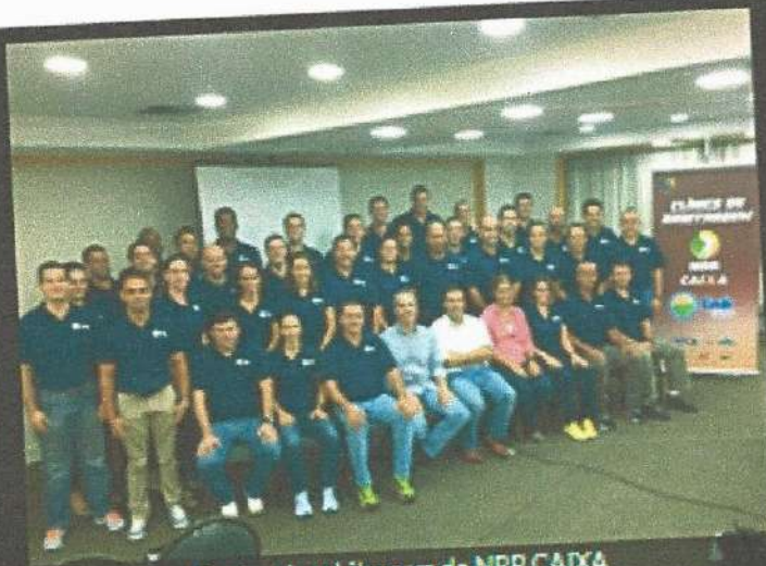
Equipe de arbitragem do NBB CAIXA

Incluindo algumas atividades em duplas ou trios, a Clínica "testou" os árbitros em diversas situações, como por exemplo o que fazer para auxiliar um companheiro a resolver um problema. Além disso, os "homens do apito" também puderam compartilhar situações vividas ao longo do primeiro turno com seus companheiros, afim de evitar os mesmos problemas na segunda metade da primeira fase do NBB CAIXA.