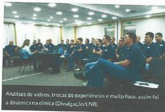
Análises de vídeos, trocas de experiências e muito foco: assim foi a dinâmica na clínica

O NBB CAIXA é uma competição organizada pela Liga Nacional de Basquete (LNB), em parceria com a NBA, e conta com o patrocínio master da CAIXA, os patrocínios da SKY, Nike e Avianca e o apoio do Ministério do Esporte.