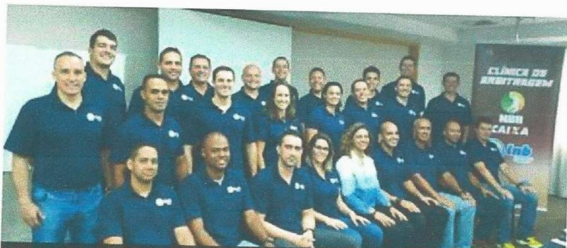
23 dos 39 árbitros do NBB CAIXA foram selecionados para os playoffs