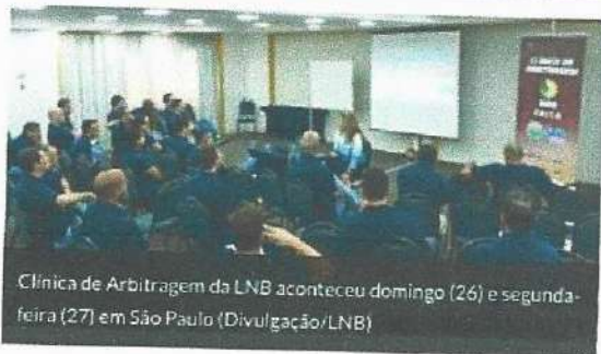
Clinica de Arbitragem da LNB aconteceu domingo (26) e segunda-feira (27) em São Paulo

Ainda entraram em pauta temas como análises de corta-luz, lances fora da bola (off the ball), parte administrativa da partida, falta antidesportiva e desqualificante, análise de contato, transição e violações, além de mecânica de trabalho em equipe e decisões individuais e coletivas.