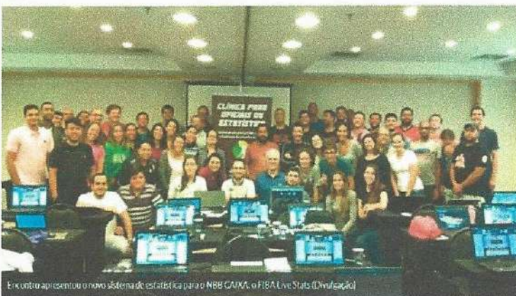
Encontro apresentou o novo sistema de estatística para o NBB CAIXA, o FIBA Live Stats

No último final de semana, em São Paulo (SP), a Liga Nacional de Basquete (LNB) promoveu o encontro entre os oficiais de estatística que atuarão na edição 2016/2017 do NBB CAIXA. O evento foi viabilizado através da Lei de Incentivo ao Esporte do Ministério do Esporte e contou com a patrocínio da SKY, assim como o Encontro dos Representantes, realizado também no sábado e domingo.